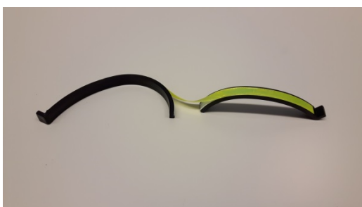
Bild 4: Bruch beim Aufbiegen einer handelsüblichen Kunststoffspange