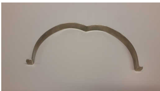
Bild 5: bleibende Deformation nach dem Aufbiegen einer handelsüblichen Metallspange